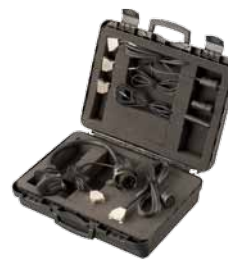
Valigia Cavi Rimorchi cod. 6011000321