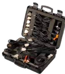
Valigia Cavi Truck Base cod. 6011000320