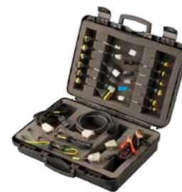
Valigia Cavi Moto cod. 6011000312