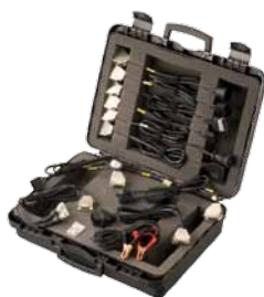
Valigia Cavi Veicoli Asiatici cod. 6011000305