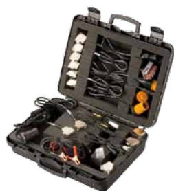
Valigia Cavi Veicoli Europe cod. 6011000300