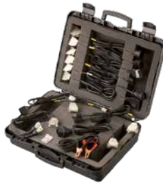
Maleta Cabos Veículos Asiáticos cód. 6011000305