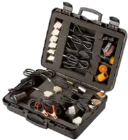
Maleta Cabos Veículos Europa cód. 6011000300